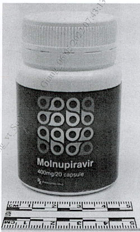
Hình ảnh thuốc thuốc giả Molnupiravir phát hiện tại Thụy Sĩ