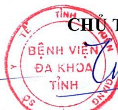
Trương Công Thành