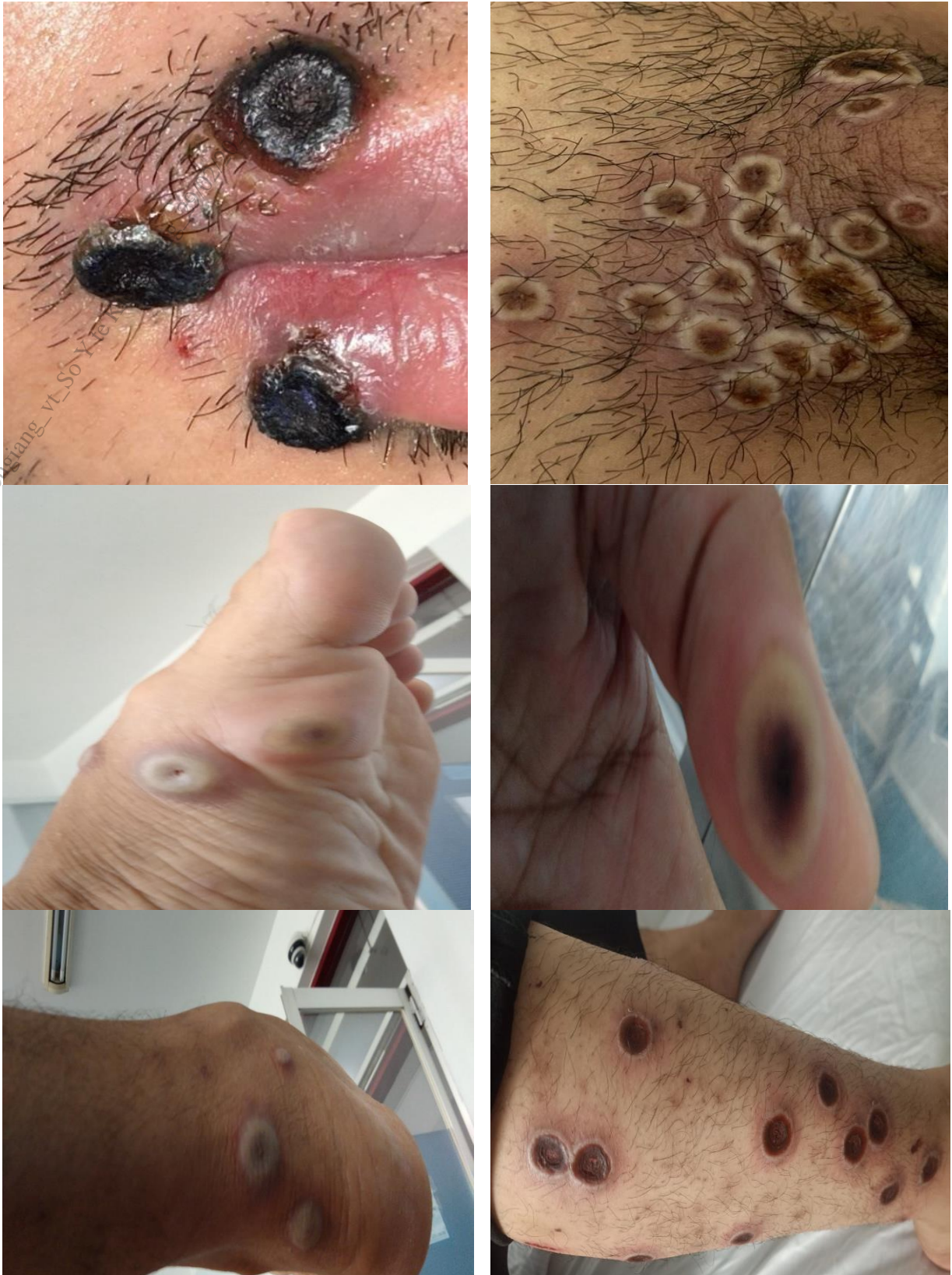
Hình 2. Hình ảnh tổn thương sâu