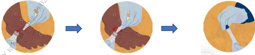
Hình ảnh minh họa về lấy mẫu da/vảy khô từ vết tổn thương

thương): sử dụng panh kẹp hoặc dụng cụ gấp (có đầu không sắc) vô trùng để gấp toàn bộ hay một phần da/vảy khô (kích thước ít nhất 4mmx4mm) rồi cho vào ống vô trùng (ống 1,5ml hoặc ống 5ml) không chứa môi trường vận chuyển. Sử dụng băng cá nhân để băng lại vết thương sau khi lấy mẫu.